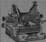
LA OLIVER DEL ULTIMO MODELO

La PRINTYPE OLIVER o sea la OLIVER con tipo de imprenta, llena el vacío de lo que había que desear en máquinas de escribir. Habiendo llegado a la cúspide por su calidad y juicioso equipo, la adición de tipo de imprenta completa el círculo de perfección elevando a la OLIVER a un plano exclusivo que ningún otro fabricante se atreva a pisar. Ninguna otra máquina supera a la OLIVER porque es imposible mejorar lo que es ya perfecto. La OLIVER representa la última palabra de la ingeniería actual, en la producción de máquinas de escribir.